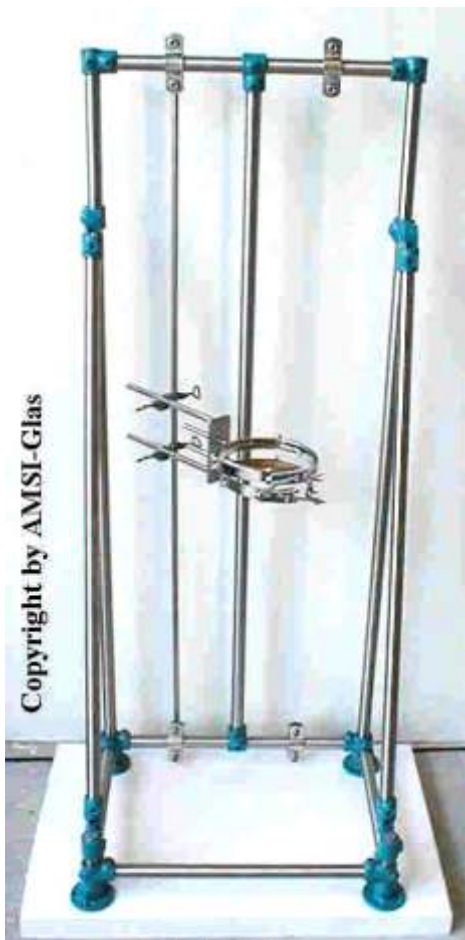
Gestell für komplette Apparatur 500 ml bis ca. 3000 ml