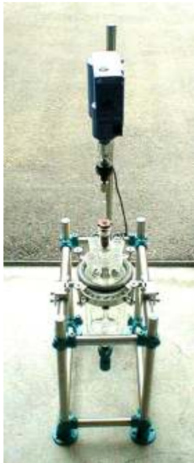
1000 ml Apparatur mit Rührwerk