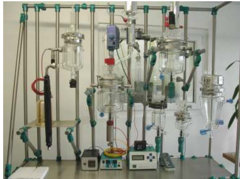
Gestell für div. Apparaturen - kundenspezifische Ausführung