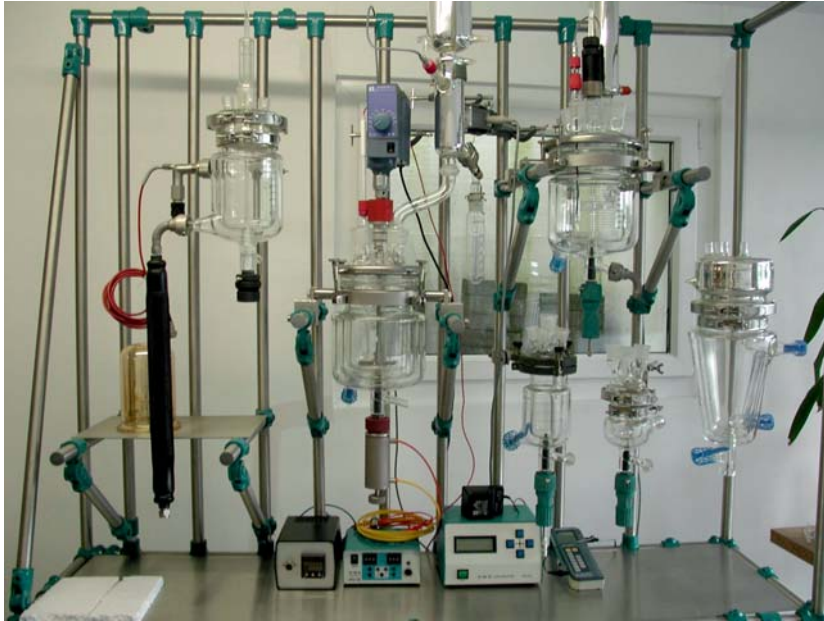
Gestell für div. Apparaturen - kundenspezifische Ausführung